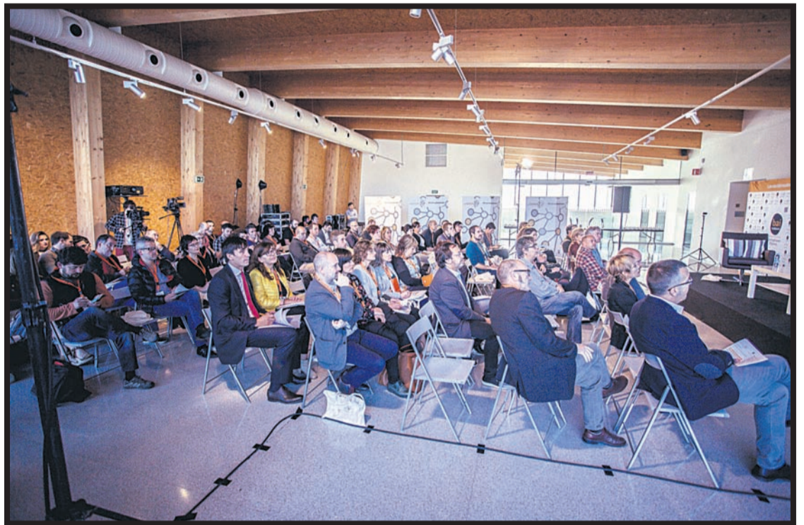
Orona enpresaren Ideo berrikuntza gunean egindako irekiera ekitaldia. BAI EUSKARARI ZIURTAGIRIAREN ELKARTEA