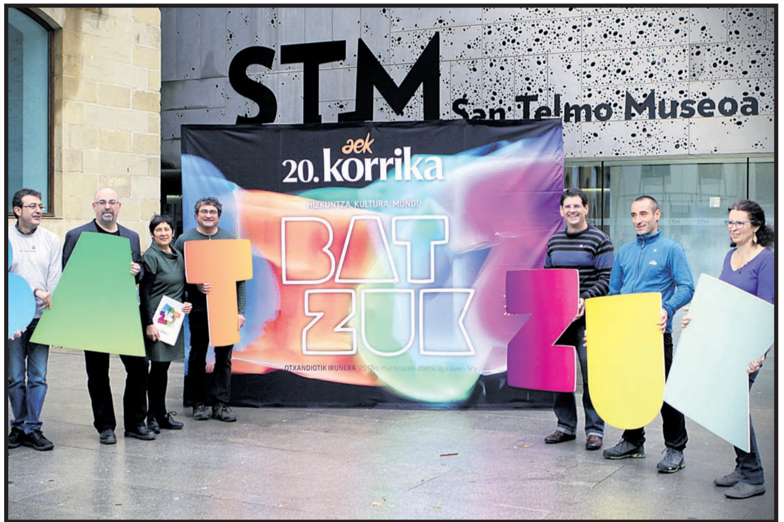
Aurkezpena Donostiako San Telmo museoan egin zen, bertan gordetzen baita Korrikaren jatorrizko lekukoa, Remigio Mendiburuk sortua.

«Aurreko Korrika amaitu zenetik euskaraz bizitzeko hautua irmoago dago euskal gizartean», nabarmendu zuen Mugikak. Euskararen normalizaziorako helduen espazioek ere euskaraz funtzionatzea ezinbes-