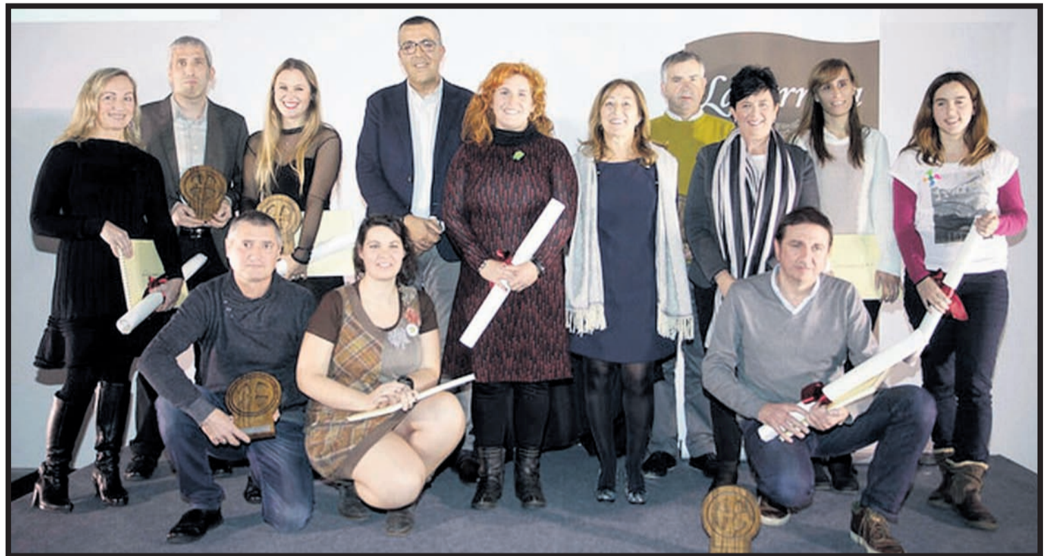
Saridunei Lazarragaren eskuizkribuan oinarrituriko litografia eta eskuizkribua bera banatu zitzaizkien. GARA

Gasteizko Amarika aretoan azaroaren 24ean izan zen sari banaketan lurraldeko enpresa