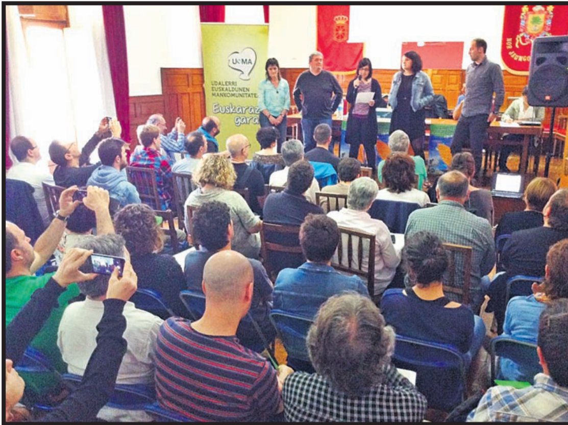
Festa eta aldarrikapena uztartuz ospatu zuten maiatzean Leitzañ Udalerri Euskaldunen Eguna.

Azken asteotan beste lau udalerrik erabaki dute Mankomunitatean sartzea, baina erakundeak kezkaz ikusten du udalerrri euskaldunak gero eta erdaldunagoak direla