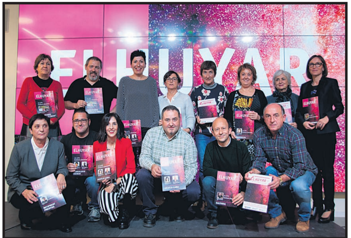
Euskara plana duten enpresen ahalegina saritu zuen Elhuyarrek azaroaren 17an Tabakaleran eginiko ekitaldian. ELHUYAR