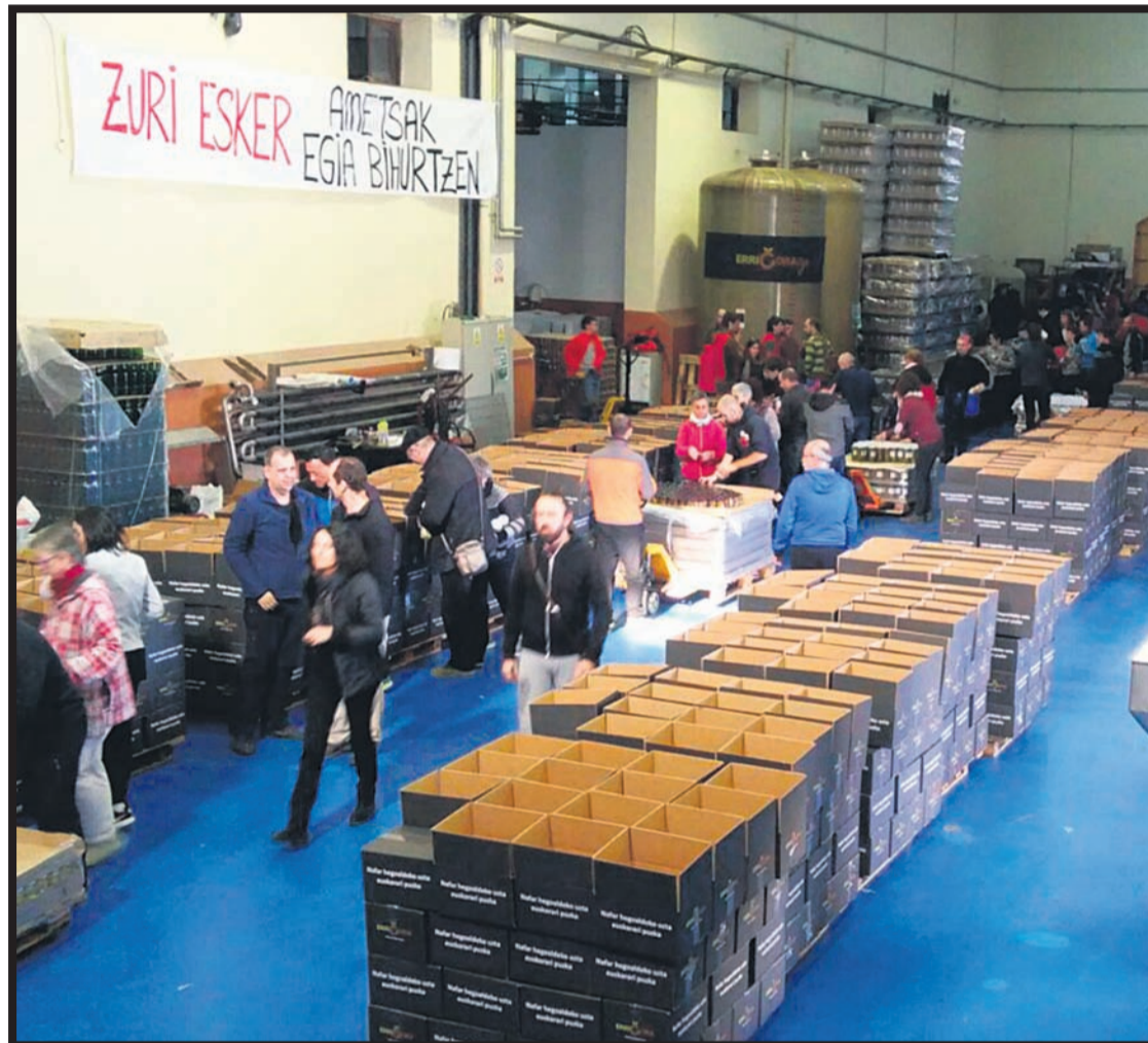
Auzolan organizado recientemente en Ablitas para preparar las cajas.

Este año han conseguido recaudar una suma de 175.000 euros. Este dinero se utilizará para ayudar a las ikastolas anteriormente citadas, a AEK de la Ribera y su sistema de becas (ha habido un incremento del 20% en las matriculaciones), así co-