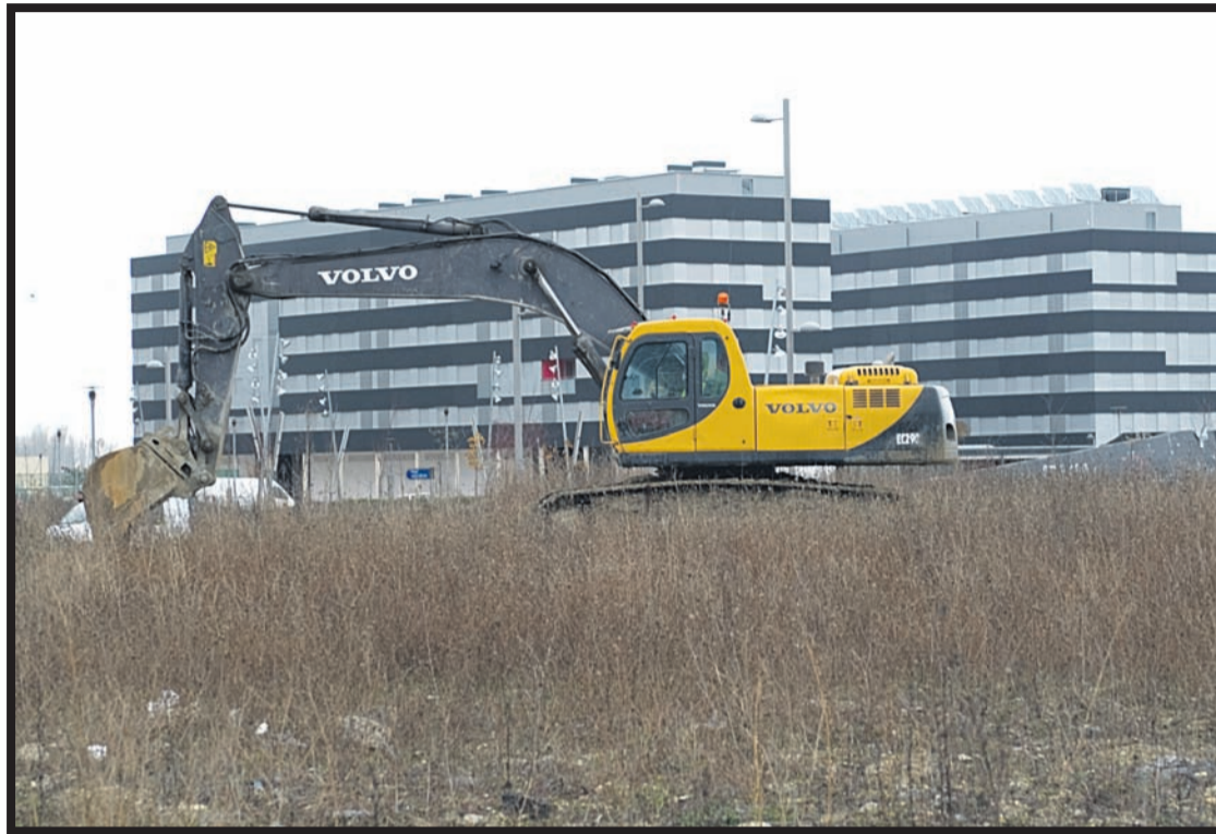
Euskara nagusi den herri txiki batean berrehun etxe berri egiteak sekulako ondorioak eragin litzake.

tu, eta "ELE/Arnasguneak hedatuz" tresnaren aplikazio legal posibleak aztertu.